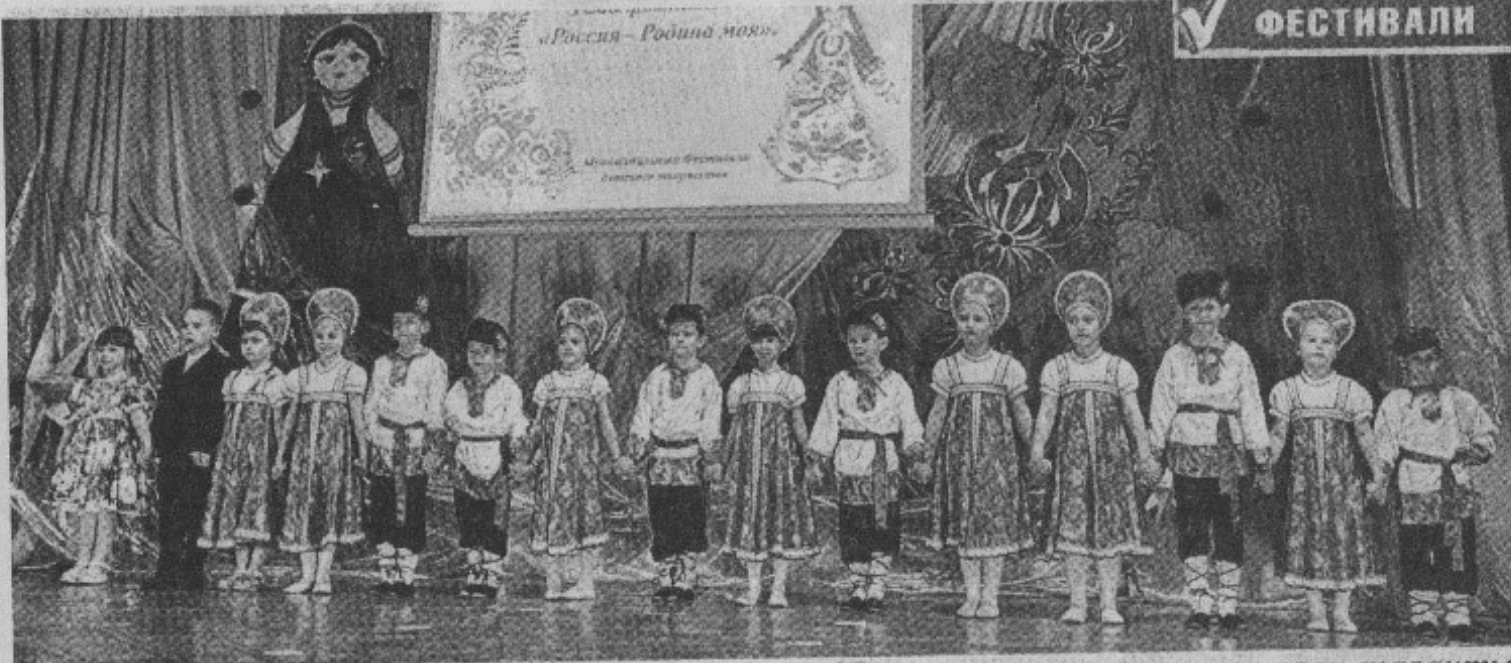
Юные артисты показали свои таланты.