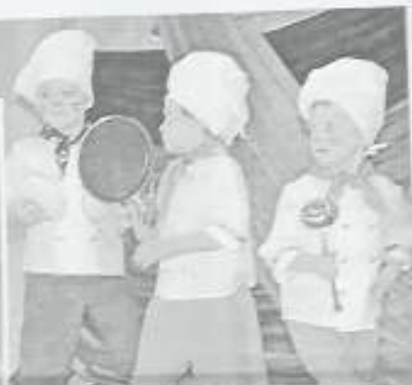
Профессии очень важны! И мы готовы, чтобы их делать!

Время в танцевально-педагогическую харушки пролетело