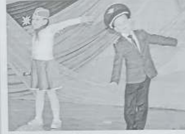
Каждому свой — герои и герои.

Победители марша награждаются дипломами министерства культуры и национальной политики Амурской области и подарками, участниками — сертификатами.