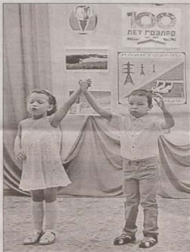
Зрители смотрели номера по видеозаписи.

Награждение всех участников фестиваля-конкурса «Звездная дорожка» пройдет в рамках празднования Дня энергетика.