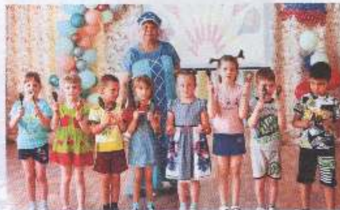
Из опыта работы

Неотъемлемой частью нашей работы является привлечение родителей воспитанников к жизни детского сада. Вместе с родителями дети готовят народные костюмы, постигая народные традиции. Конкурс «Костюм к народному празднику»